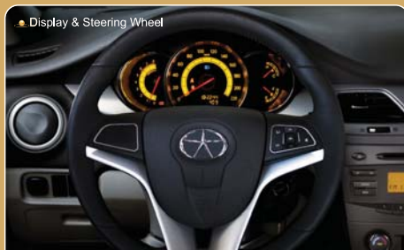
Display & Steering Wheel