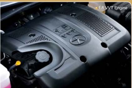
1.5 VVT Engine